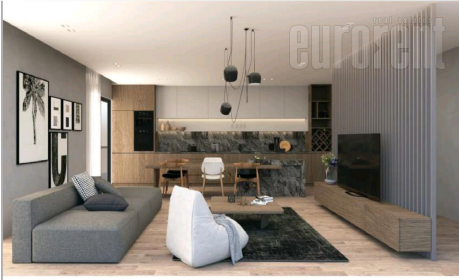
KUHINJA I DNEVNA SOBA