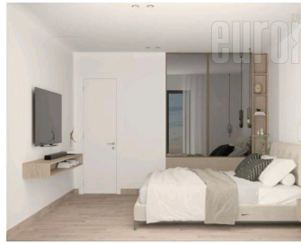
SPAVAĆA SOBA I