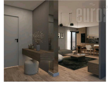
KUHINJA I DNEVNA SOBA