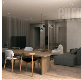
KUHINJA I DNEVNA SOBA